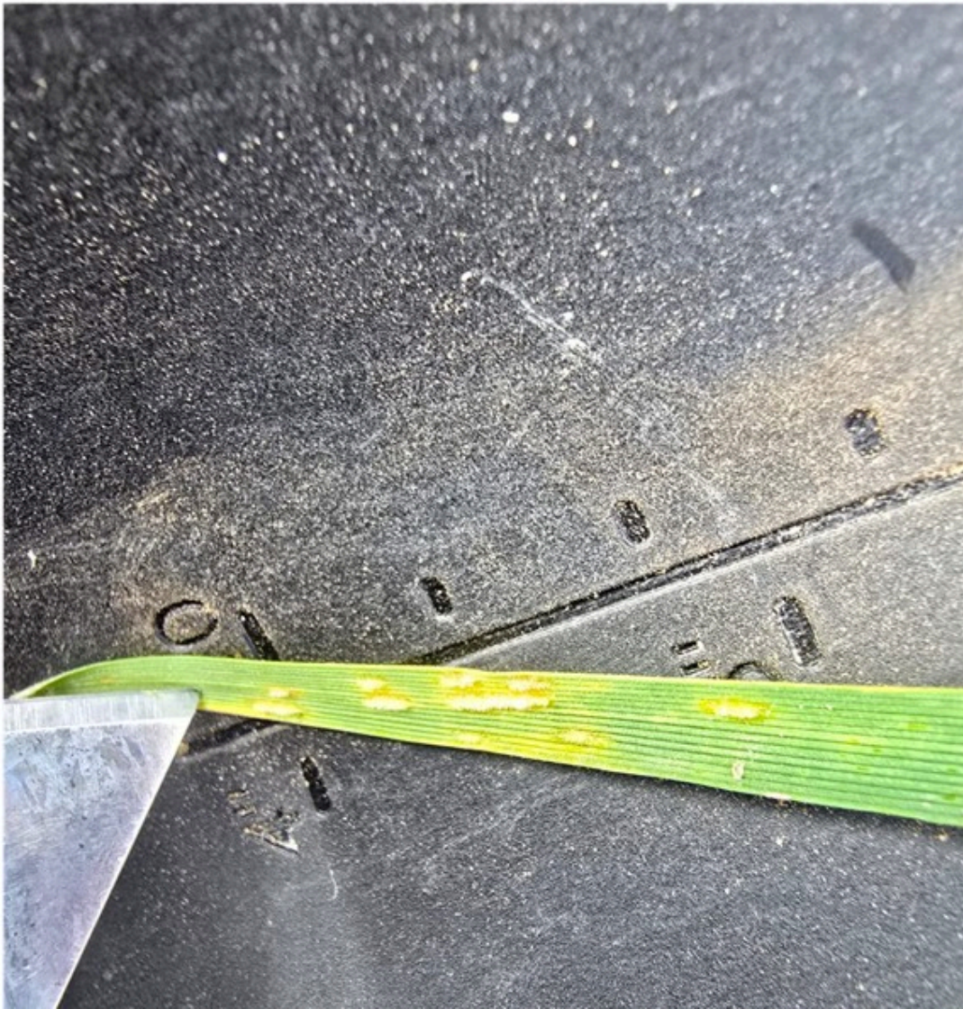
Obrázok 1 Viditeľné kôpky mycélia na liste v poraste