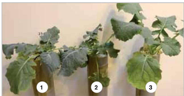
Rozdiel v dĺžke stoniek , rozdiel vo farbe listov - koncentrácia chlorofylu

Účinok prípravku REGULATO 300 SL bol predmetom našich poľných pokusov v sezóne 2024. Z výsledkov môžeme konštatovať, že oproti kontrole (CCC), prišlo k nárastu vo všetkých sledovaných parametroch - úroda t/ha, N-látky, lepok. Oba prípravky, boli aplikované v BBCH 29-30. Výsledky sú spracované i na príslušnom grafe.