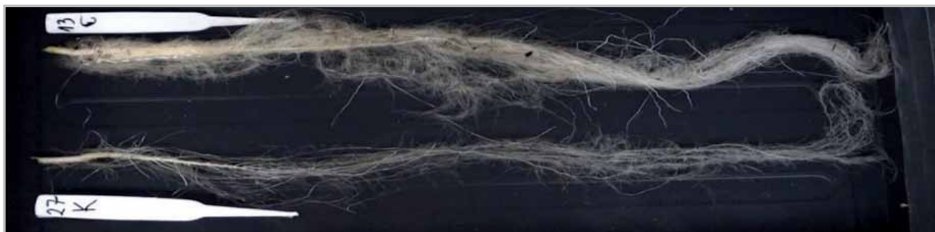
Vplyv Regulato 300 SL na koreňový systém.