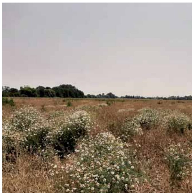
Výskyt parumančeka v porastoch repky

Aplikácia vyžaduje vyššiu teplotu kedy buriny už dostatočne vegetujú. Prípravok MAJOR 300 SL spoľahlivo kontroluje i ťažko ničiteľné buriny ako pichliač roľny, ruman a iné.