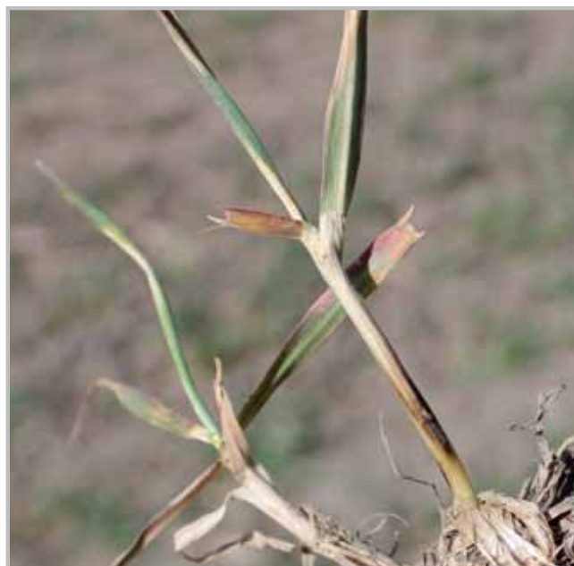
Stebľolam - pšenica

Proti hnedej škvrnitosti jačmeňa ošetríte pri objavení sa prvých príznakov, od začiatku predlžovania stebľa do konca metania (BBCH 30-49).